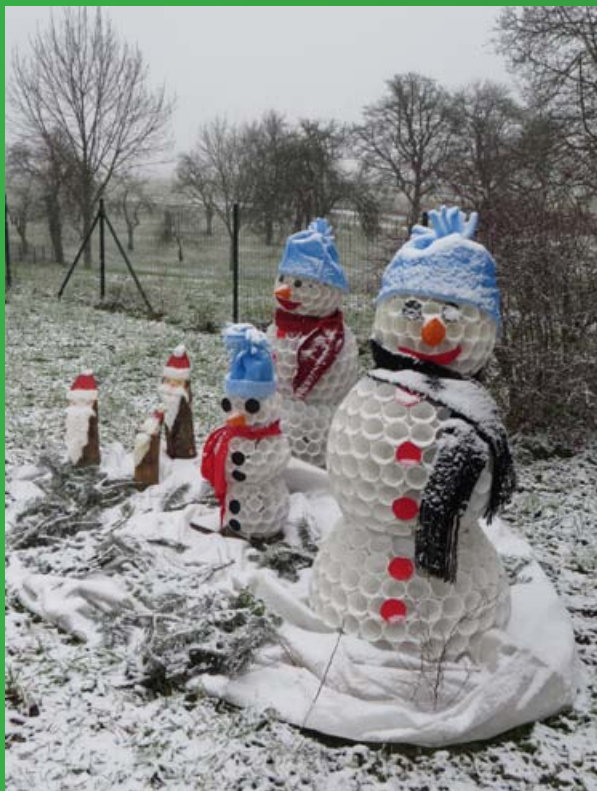
Snežaki v Dobrovcah