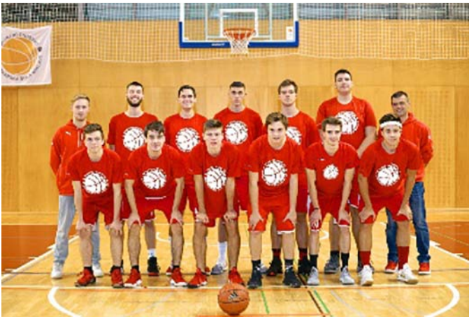
Ekipa članov 2018/19