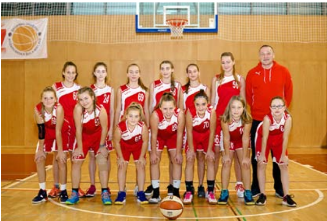
Ekipa starejših deklic OŠ Miklavž na Dravskem polju

osnovnih šol in s prebijanjem ledu na prvem turnirju postavila temelje za udeležbo na nadaljnjih tekmovanjih.