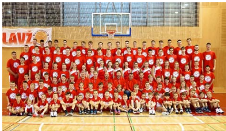
Košarkarska šola Miklavž

V preteklem letu je Košarkarska šola Miklavž dosegla nekaj odmevnih uspehov in dogodkov. Že deveto leto zapored smo naše igralke in igralce peljali na poletne priprave v Poreč, tokrat v rekordnem številu, bilo nas je namreč 63. Našim igralcem tudi v poletnem času omogočimo treninge košarke dva- do trikrat dnevno, hkrati pa se igralci družijo z vrstniki, plavajo, krepijo socialne stike in osebnostno rastejo.